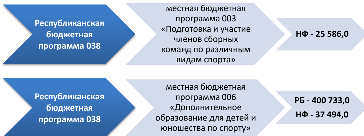
Диаграмма №3 (тыс.тенге)