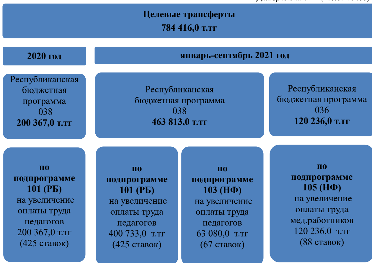
Диаграмма №1 (тыс.тенге)

Первоначально в 2020 году в рамках исполнения республиканской бюджетной программы 038 «Обучение и воспитание одаренных в спорте детей» по подпрограмме 101 «Целевые текущие трансферты областным бюджетам, бюджетам городов республиканского значения, столицы на увеличение оплаты труда педагогов государственных организаций среднего и дополнительного образования за счет средств республиканского бюджета» (далее – РБ БП 038101) выделены средства на общую сумму 200 367,0 тыс.тенге на увеличение оплаты труда педагогов государственных организаций образования в сфере спорта города Нур-Султан на основании ППРК от 6 ноября 2020 года №742 о внесении дополнения в ППРК от 6 декабря 2019 года №908